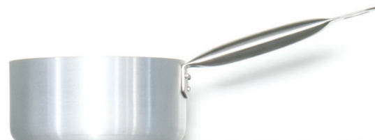
KASEROLA 16 cm / 1.3