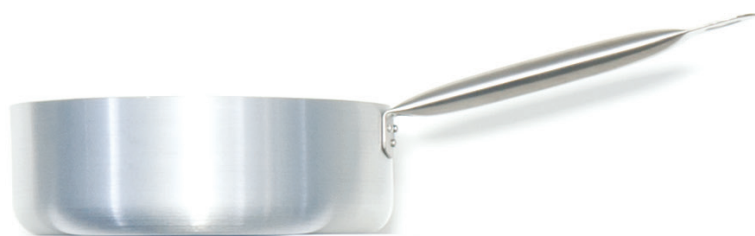
KASEROLA 24 cm / 3.6 l