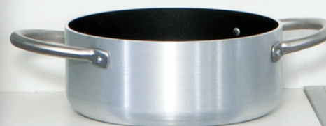
PLITKA ŠERPA 20 cm / 2.3 l