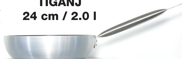
TIGANJ 24 cm / 2.0 l