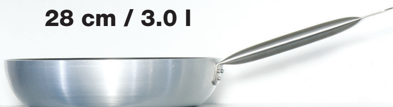
TIGANJ 28 cm / 3.0 l