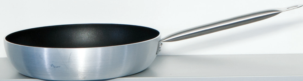
TIGANJ 32 cm / 4.6 l