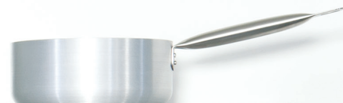
KASEROLA 20 cm / 2,3 l